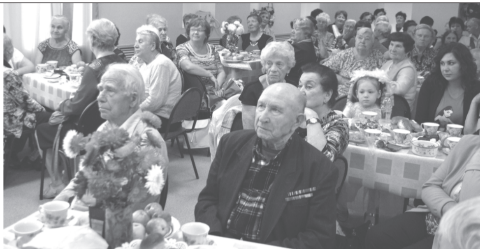
Полный зал юбиляров