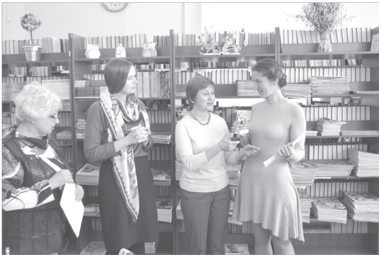
Нежданная награда приятна вдвойне

В Приволжске состоялся V межрегиональный фестиваль библиотечных проектов «Мы можем всё!».