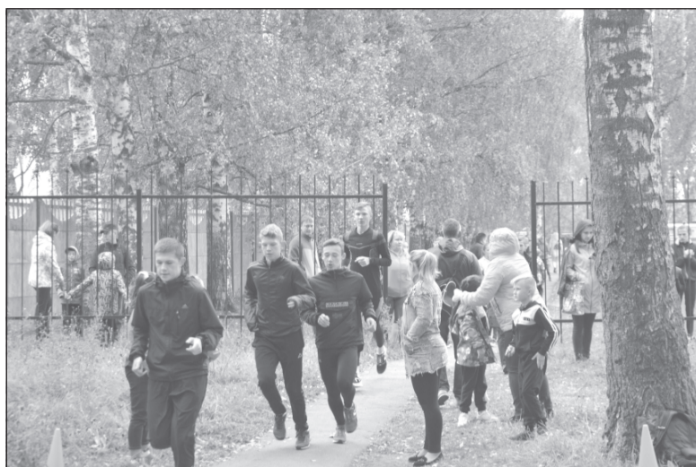
Разминка перед основным забегом

Первыми на старт вышли работники администрации.