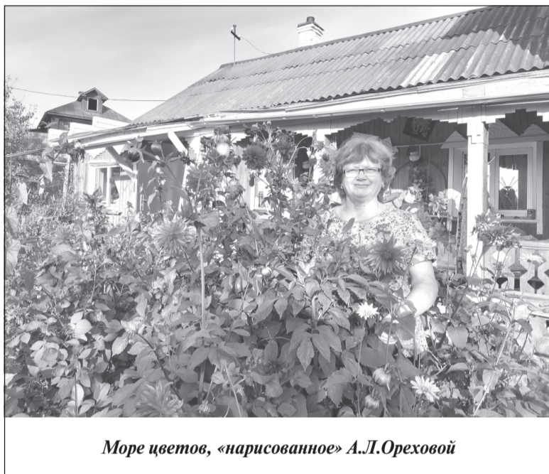
Море цветов, «нарисованное» А.Л.Ореховой