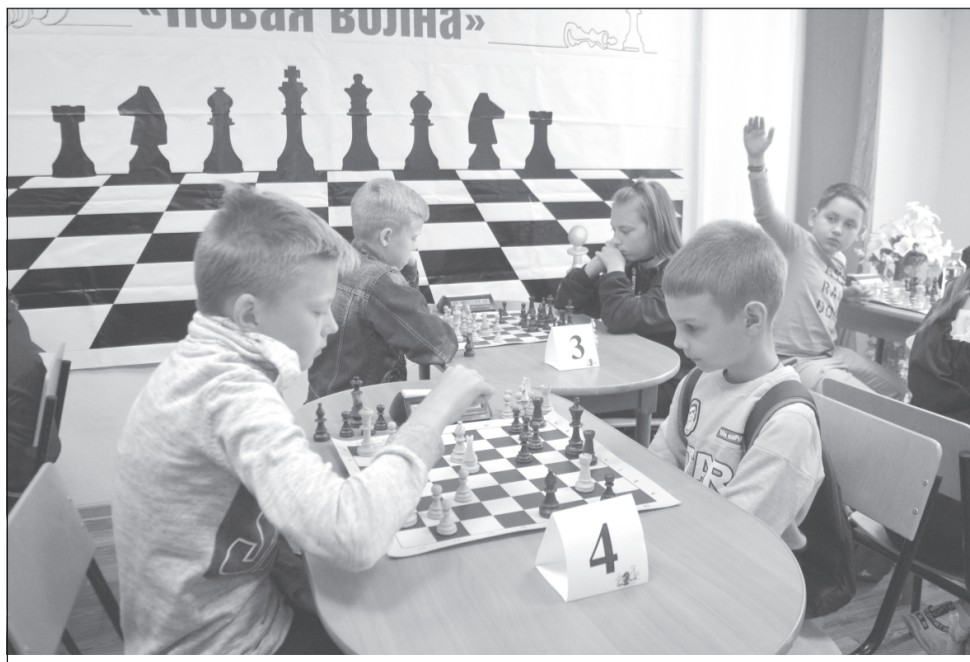
Юные начинают и выигрывают!