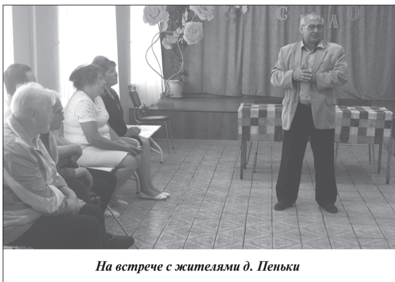
На встрече с жителями д. Пеньки

«А что нам делать, если температура в квартире во время холодов будет ниже нормы?», - поинтересовались жители. Было разъяснено, что в этом случае необходимо обращаться в ресурсоснабжающую организацию. Реакцией на обращение должна стать проверка с выходом комиссии, которая произведет замеры температурного режима помещения. Если