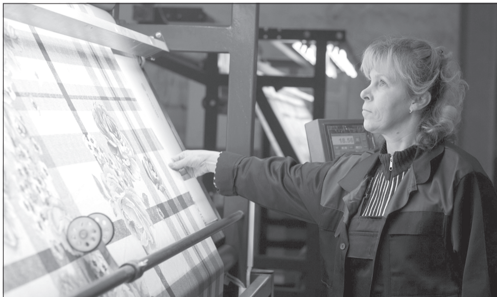
Текстильным предприятиям-экспортёрам региона компенсируют часть затрат на транспортировку продукции.

промторга России, и соответствующие документы, которые позволят нашим компаниям пользоваться этой субсидией, подготовлены», — сообщил губернатор Ивановской области Stanisлав Воскресенский в ходе заседания правительства.