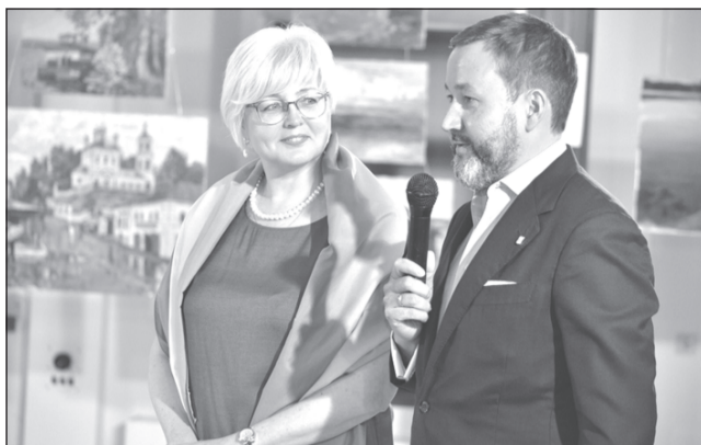
Плёс в очередной раз подтвердил свои художественные традиции