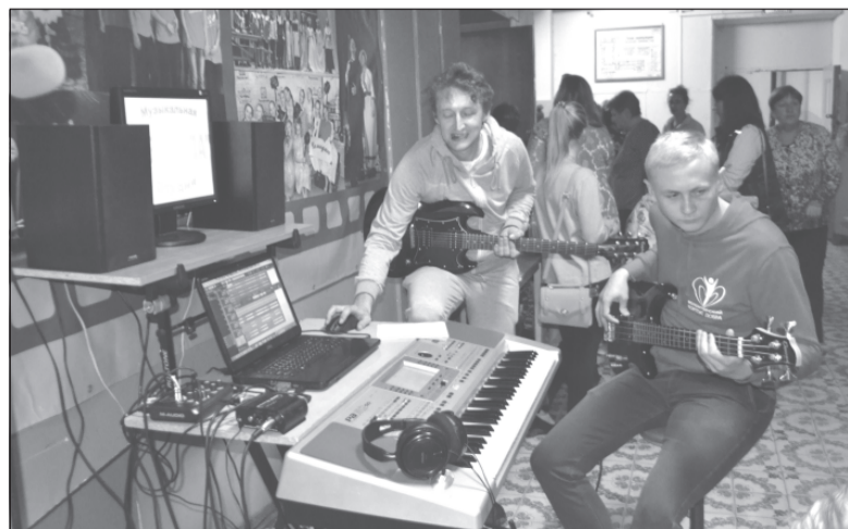
Презентация студии «Свобода»