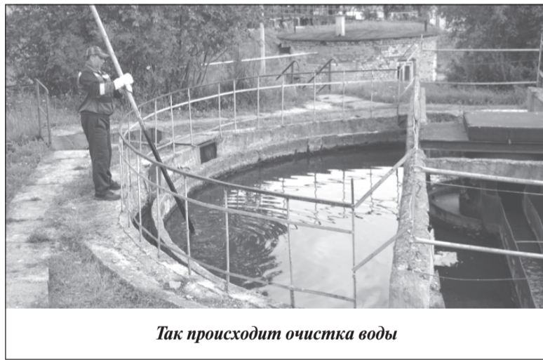
Так происходит очистка воды