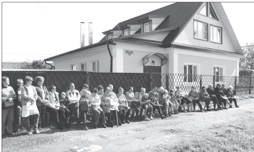
Не беда, что нет сцены, праздник можно провести и на улице