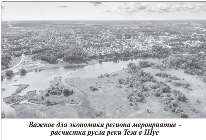
Важное для экономики региона мероприятие - расчистка русла реки Теза в Шуе

чистке русла реки Теза в городе Шуя. Начала работать новая линия на ивановском мусоросортировочном заводе, которая позволит увеличить объем обрабатываемых отходов почти в два раза и таким образом значительно снизить объемы мусора, который направляют для захоронения на полигоны. Кроме того, в регионе запущена в работу линия по переработке изношенных шин.