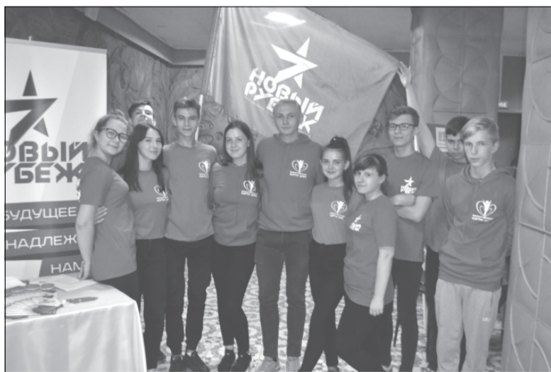
«Новый рубеж» приглашает

В 84-ый раз (!) наш дом культуры (бывший за эти годы и нардомом, и клубом, и дворцом культуры и т.д.) пригласил жителей города найти себе занятие по душе в его стенах. Данное учреждение для того и существует, чтобы организовать досуг людей, раскрыть их таланты.