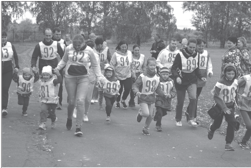
Вперёд, к победе!

Это был так называемый VIP-забег. Затем, наконец-то, настал звёздный час для дошкольников! Кто, как полагается, бегом, а кто и у папы на руках, но все преодолели свою дистанцию. «Как же я проголодался!», - произнёс маленький мальчик после своего «марафона». Ну, очень кстати приплыли тут сладкие подарки, приготовленные как раз для маленьких сладкоежек.