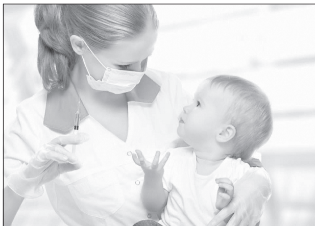
В первую очередь иммунизация будет проведена малышам

Руководитель ведомства также добавил, что в текущем году в рамках регионального проекта «Старшее поколение» нацпроекта «Демография» впервые привиты против пневмококковой инфекции 1770 граждан старше трудоспособного возраста из «групп риска», проживающих в организациях соцобслуживания. На эти цели направлено 3 млн рублей из средств федерального бюджета.