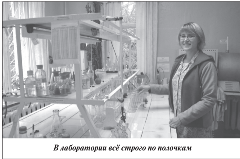
В лаборатории всё строго по полочкам